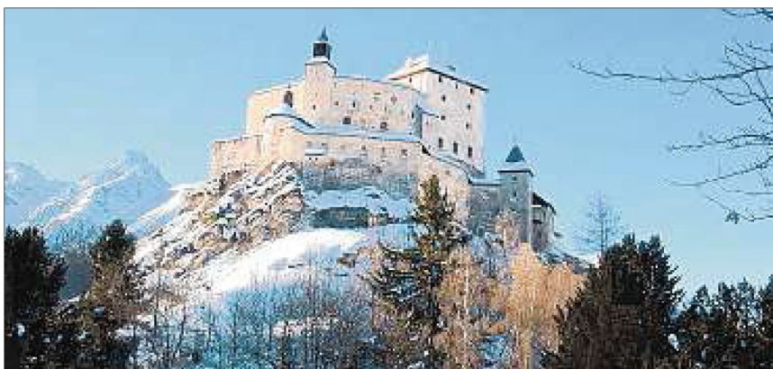
Das Jahr 2012 wird entscheidend für das Schloss Tarasp.

Es ist unübersehbar, das imposante Schloss Tarasp kurz vor Scuol, eingebettet in die Unterengadiner Berge. Majestätisch ruht es auf einem markanten Hügel, mit Blick das Tal hinunter und hinauf. Nichts blieb den Schlossherren verborgen in den Wirren des Mittelalters oder als die Reformation durchs Tal zog. (Noch heute ist Tarasp eine katholische Gemeinde mitten im reformierten Engadin.) Von gleicher Bedeutung gebe es in der Schweiz nur den Munot in Schaffhausen, die Schlossfestung von Bellinzona und das Schloss Chillon bei Montreux, schreibt die Stiftung Pro Chasté da Tarasp, die sich den Erhalt des Schlosses auf die Fahne geschrieben hat.