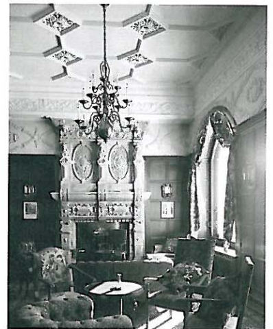
Hotel Carlton, Kamin in der Halle, Aufnahme um 1920.