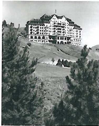
Hotel Carlton, Aufnahme um 1920.