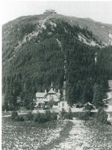
Muottas Muragl mit der Talstation, der Muottas-Muragl-Bahn und dem Aussichtshotel Muottas Muragl, Aufnahme um 1910.