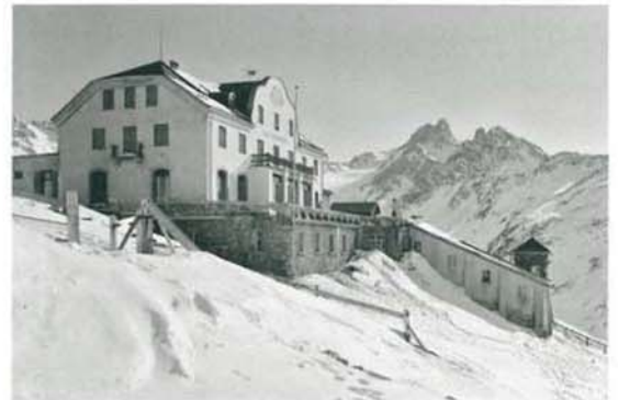
Hotel Muottas Muragl mit der integrierten Bergstation, Aufnahme um 1910.