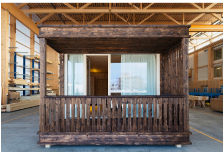
Balkon: Wie alle Module energiesparsam konstruiert

Man könnte ein olympisches Dorf aus solchen Modulen als typische Schweizer Lösung bezeichnen: vernünftig, gut gemacht und nicht ganz billig. Die Herstellung eines Moduls kostet rund 100 000 Franken. Der erste Prototyp hat den Steuerzahler aber noch nichts gekostet: Um ihre Idee zu veranschaulichen, finanzierten die beiden Unternehmen Fanzun und Uffer unter dem Patronat von Graubünden Holz ein Modul in Originalgrösse. Während der nächsten Wochen ist es unterwegs im Bündnerland – und soll endlich das olympische Feuer entfachen.