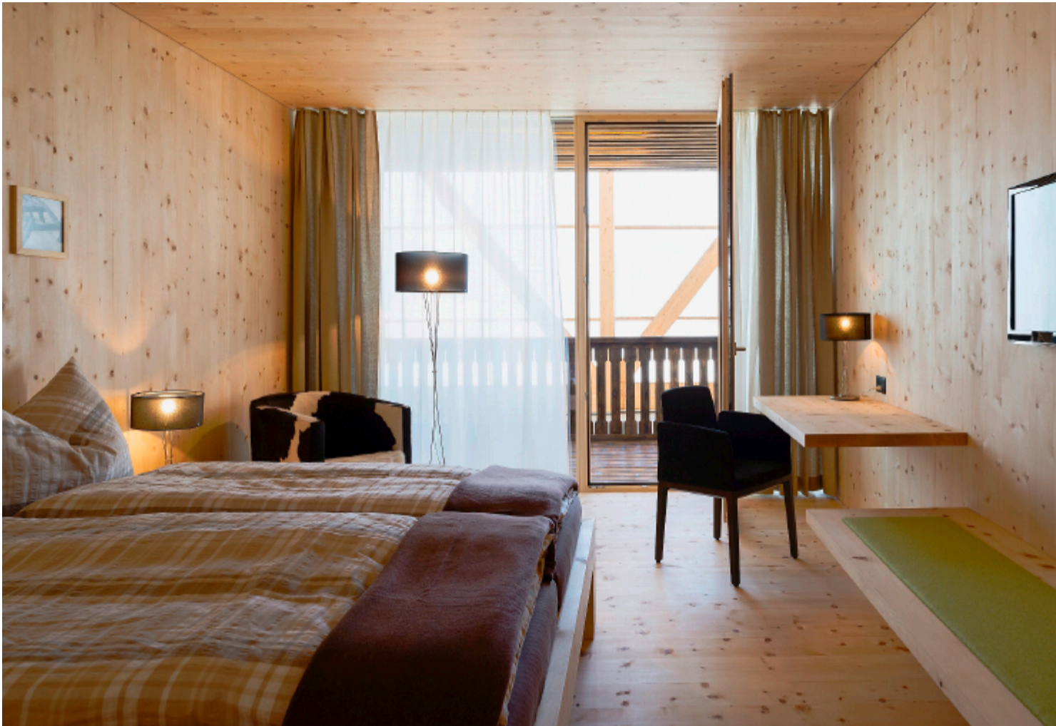
Sportlerzimmer: Alpines Flair durch viel einheimisches Arvenholz, schlichte Möblierung