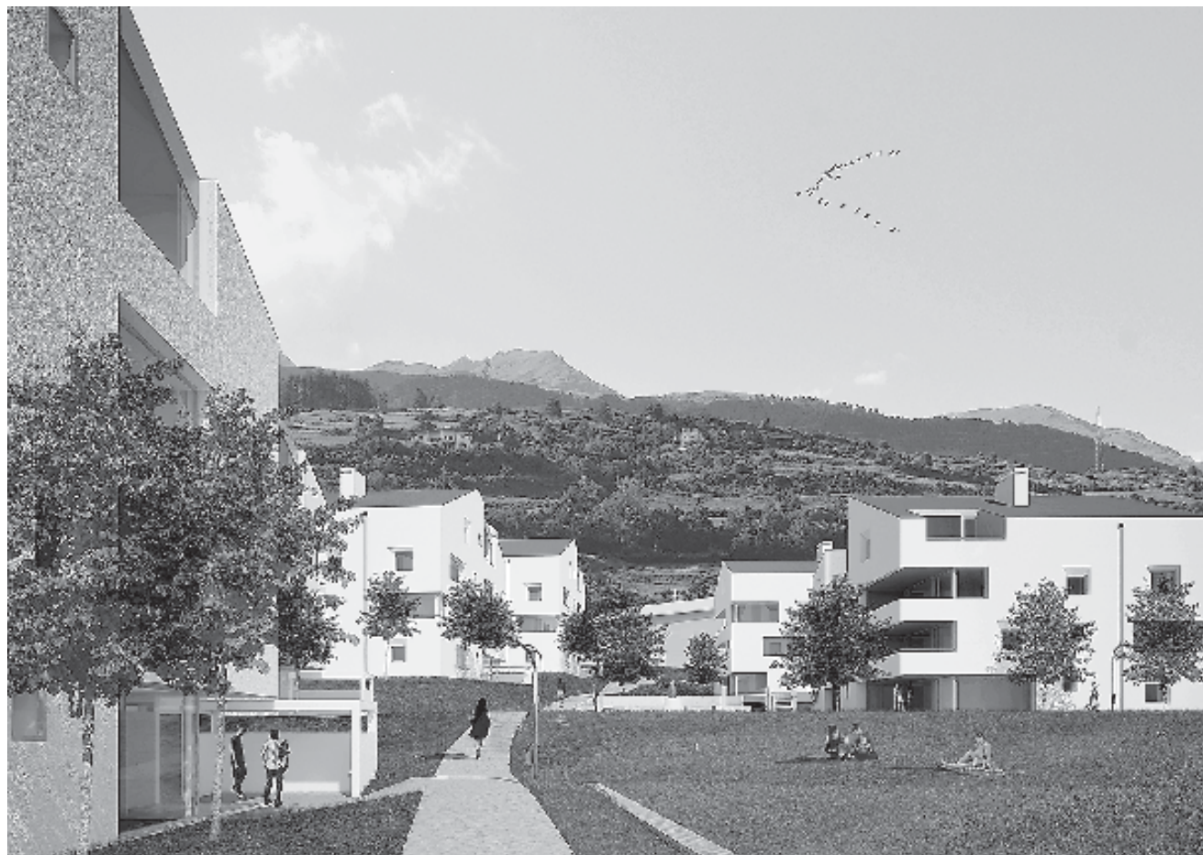
In gövgia ha gnü lö la prüma palada da la prüma part dal proget Sotchà cun intant nouv chasas d'abitar e 64 abitaziuns.

A Sotchà d'essan gnir fabricadas, là ingio chi gniva plü bod lavurà, nouv chasas d'abitar cun insemel 64 abitaziuns. Las chasas vegnan fabricadas da maniera chi dà tanteraint grondas surfatschas libras. «60 pertschient da la surfatscha d'abitar es prevista sco abitaziuns d'aigna proprietà e sco abitaziuns per indigens e per fittar, 40 pertschient stan a disposiziun per giasts», ha orientà Gian Fanzun da la ditta Fanzun AG in gövgia passada a Scuol. La fabrica dess d'urar fin la fin da l'on 2018. La prüma etappa dess esser abitabla la fin dal 2015. Per accumplir tuot las pretaisas vegnan construidas abitaziuns da duos e mez fin quatter e mez stanzas d'abitar. «Tuot las unitats vegnan fabricadas tenor las pretaisas d'hozindi e las singulas chasas dal quartier as rechattan aint in üna zona libra dal trafic dad autos», ha'l continuà. A partir da l'on 2015 esa previs da fabricar al süd da la surfabricaziun actuala ün ulteriur proget cun ses chasas singulas cun 12 abitaziuns. Il permiss da fabrica per quella part es gnü dat dal 2013.