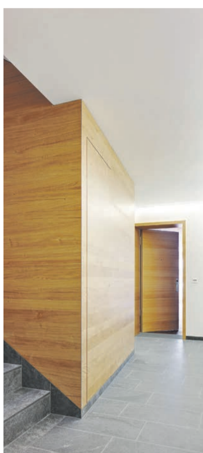
Treppenhaus in Eiche