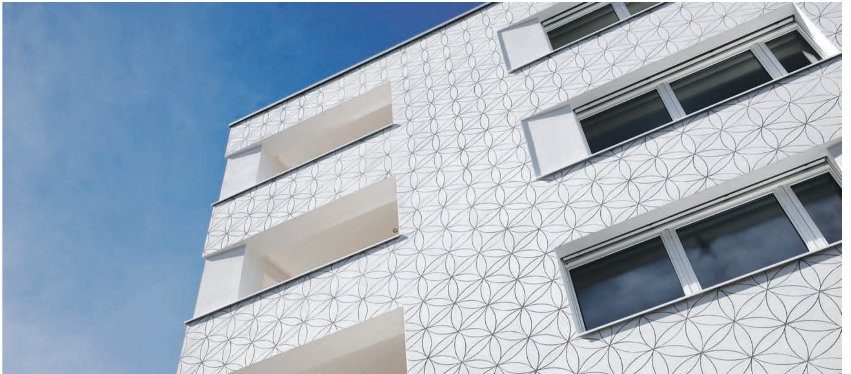
Chesa Central / aussen