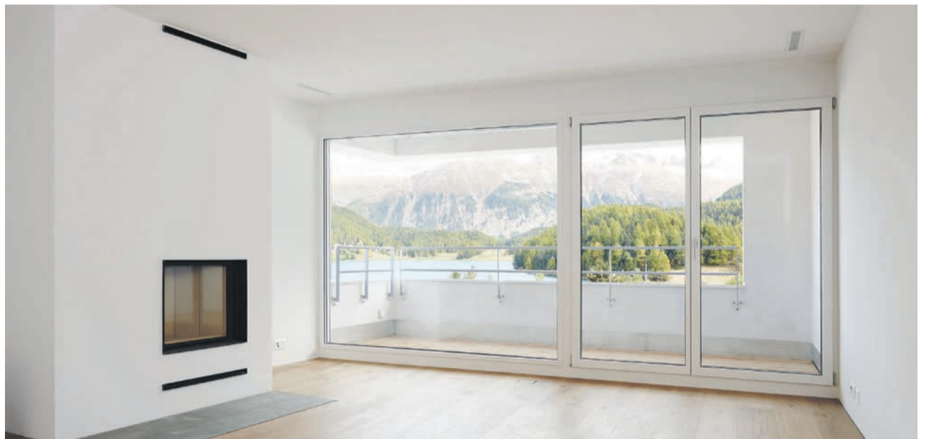
Wohnzimmer mit Blick nach aussen

sprechenden Einsparungen bei den Nebenkosten. Die Bauherrschaft hat das Gebäude mit Baumeister Martelli AG, Elektro Merz AG, Bissig Bedachungen AG, Christian Lisignoli und der Hartmann AG für Naturstein neben diversen weiteren einheimischen Unternehmern realisiert. Die Malloth Holzbau zeichnet für den Innenausbau mit rustikalen und dennoch modernen Parkettböden, Türen, Küchen und Einbauschränken verantwortlich. Das Sicherheits-