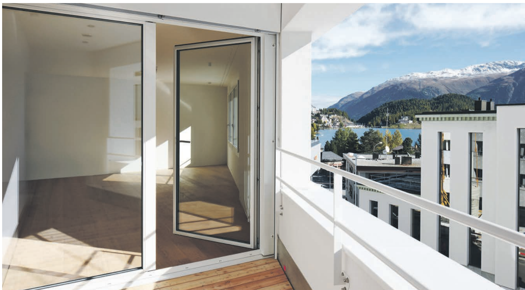
Blick innen / aussen

Markus Kirchgeorg, markus.kirchgeorg@malloth-immobilien.ch Tel. 081 830 0070