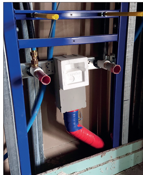
Die vorinstallierten Sanitäranlagen in den Nasszellen der Zimmer.

Der Baufortschritt kann jederzeit auf der Webseite der Stiftung Dankensberg ( www.dankensberg.ch ), inklusive Webcam, angeschaut werden.