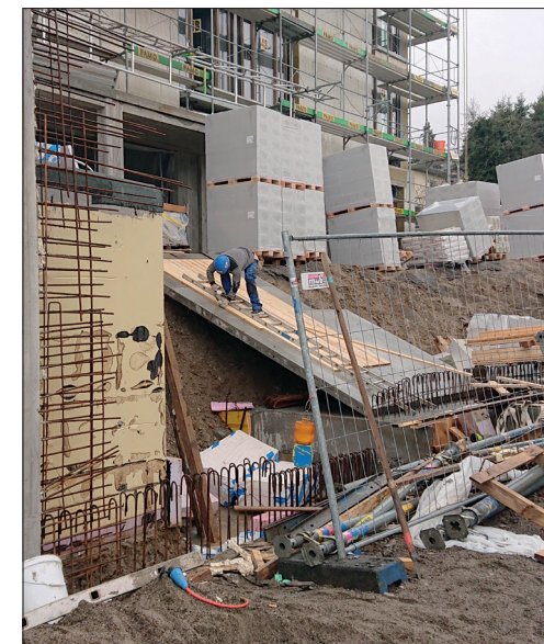
Aussenansicht des Haupteingangs.