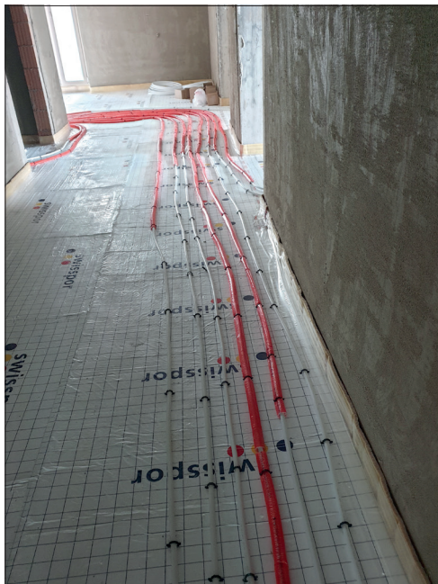
Die Bodenheizungsrohre werden verlegt.

Das Alters- und Pflegeheim Stiftung Dankensberg in Beinwil am See wird mit einem grossen Neubau erweitert. Das legendäre Gründergebäude Haus A und auch das Haus B mussten abgerissen werden. In einer monatlichen Serie schauen wir in die Zukunft und informieren aktuell.